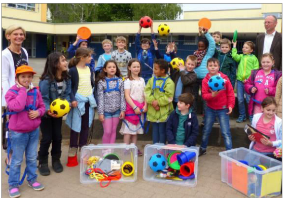
Für jede Klasse ein Kiste mit Spiel- und Sportsachen. Die Geräte finanzierte der Förderverein.